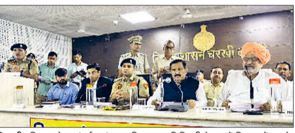
भिवानी। जिला लोक संपर्क एवं कष्ट निवारण समिति की बैठक में शिकायतें सुनते कृषिमंत्री श्याम सिंह राणा।

सरकार प्रदेश के किसानों के साथ खड़ी है और लगातार किसानों की भलाई के कार्य कर रही है। प्रदेश की मंडियों में एमएसपी पर फसलों का दाना दाना खरीदा जा रहा है। अधिकारियों को निर्देश दिए गए हैं कि फसल खरीद के दौरान किसी भी किसान को परेशानी का सामना ना करना पड़े। कोई हरियाणा के कृषि एवं किसान कल्याण मंत्री श्याम सिंह राणा दादरी में जिला लोक संपर्क एवं कष्ट निवारण समिति की