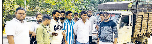
भिवानी। मामले की जानकारी देते गोरक्षक।

भिवानी से कनीना-महेंद्रगढ़ रोड़ पर मंगलवार की दरमियानी रात गौतस्करों और गौरक्षा दल के बीच एक लंबी मुठभेड़ हुई, जिसमें गौतस्करों दो पिकअप वाहनों में गाँवों को भरकर फरार होने में सफल रहे। इस घटना ने क्षेत्र में गौतस्करों के बढ़ते आतंक को उजागर किया है, वहीं मौके पर मौजूद पुलिसकर्मियों की कार्रवाई पर गंभीर सवाल खड़े हो गए हैं। घटना की शुरुआत गांव हालुवास से हुई। गांव के निवासी