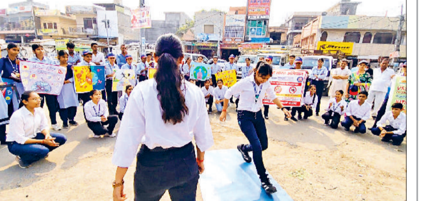
भिवानी। नुकड़ नाटक का मंचन करते विद्यार्थी।