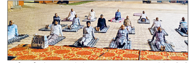
चरखी दादरी। योगाभ्यास करते लोग।

योग को अपनाकर आज सारा विश्व निरोगी शरीर पाने के लिए आगे आ रहा है, आज भारतीय संतों व ऋषियों ने दिया, ये वक्रान पूरे संसार के लिए ऐसा मार्ग बन चुका है जिस पर चलकर न सिर्फ शारीरिक उर्जा का विकास सभी कर रहे है। साथ में ये सकारत्मकता की और हमारी सोच को अग्रसर करने में सहायक भी है, इसलिए प्रभात मंडल का यही प्रयास है कि सभी के बीच करो योग रहो निरोग का संदेश अधिक से अधिक पहुंचे। यह आह्वान योगाचार्य