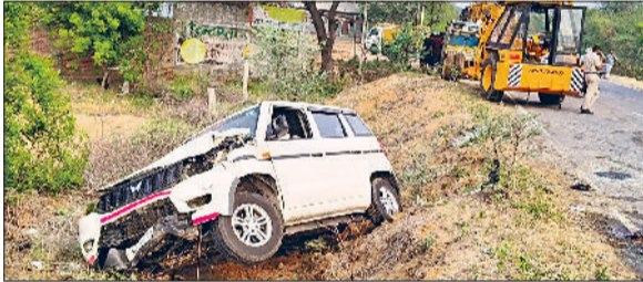
तोशाम। खाई में गिरने से क्षतिग्रस्त हुई गाड़ी।

तोशाम को भिवानी से जोड़ने वाला तोशाम-भिवानी मार्ग ऊंचा तथा संकरा होने के कारण दिन-प्रतिदिन हादसों का मार्ग बनता जा रहा है। जिसके कारण अब तक अनेक वाहन चालक काल का ग्रास भी बन चुके हैं लेकिन संबंधित विभाग, प्रशासन तथा सरकार के नुमाइंदे इस तरफ कोई ध्यान नहीं दे रहे हैं। उल्लेखनीय है कि तोशाम-भिवानी मार्ग काफी ऊंचा बना हुआ है जिसके कारण सड़क के दोनों