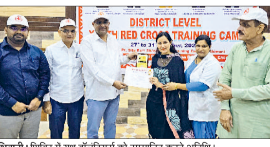
भिवानी। शिविर में यूथ वॉलंटियर्स को सम्मानित करते अतिथि।