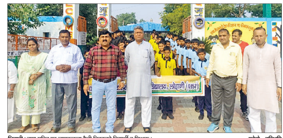
भिवानी। नशा मुक्ति पर जागरूकता रैली निकालते विद्यार्थी व शिक्षक।