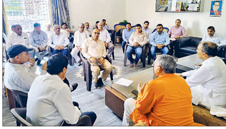
बाढ़ड़ा। विधानसभा क्षेत्र के विकास कार्यों की समीक्षा बैठक में अधिकारियों से चर्चा करते सांसद धर्मबीर सिंह अन्य अधिकारी।

हरिभूमि न्यूज ►► बाढ़ड़ा सांसद धर्मबीर सिंह ने बाढ़ड़ा विधानसभा क्षेत्र के विकास योजनाओं के लिए आवंटित बजट को निर्धारित समयावधि में खर्च करने पर देरी बरतने पर कड़ी फटकार लगाई तथा सभी विकास कार्यों को जल्द पूरा करवाने का आदेश दिया। उन्होंने सभी विभागों के अधिकारियों से किसान को डीपीए, गांव में गंदे पानी की निकासी, स्वच्छ पेयजल, शिक्षा व चिकित्सा क्षेत्र के लिए आवंटित बजट को त्वरित तौर पर खर्च कर आमजन को राहत पहुंचाने का दिशा निर्देश देते हुए बाढ़ड़ा में लघु सचिवालय निर्माण, कृषि क्षेत्र में ट्यूबवेल कनेक्शन में देरी बरतने, चकबंदी जैसे कामों में आपसी भाईचारे की भावना से इसे सिरे चढ़ाने की नसीहत दी। सांसद व विधायक ने हर तीन माह में प्रगति रिपोर्ट तैयार करने का भी आदेश दिया।