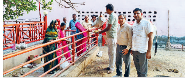
बहल। श्री अलख गोशाला में गाँवों की पूजा करते हुए गोभक्त।