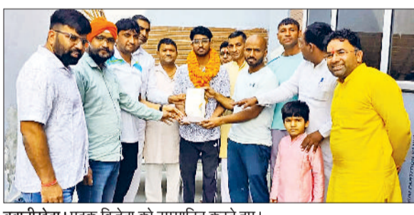
बवानीखेड़ा। पदक विजेता को सम्मानित करते हुए।