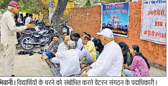
भिवानी। विद्यार्थियों के धरने को संबोधित करते वैटरन संगठन के पदाधिकारी।

हरिभूमि न्यूज ►► मिवानी चौधरी बंसीलाल विश्वविद्यालय में समाज कार्य और पत्रकारिता विभाग की स्नातकोत्तर डिग्री को डिफेंसामें बदले जाने के विरोध में विश्वविद्यालय के सामने विद्यार्थियों का धरना बुधवार को 22वें दिन भी जारी रहा। इस लंबे संघर्ष को अब वैटरन संगठन भिवानी का मजबूत समर्थन मिल गया है, जिसके बाद विद्यार्थियों के हौसले बुलंद हैं। बुधवार को धरने को समर्थन देने के